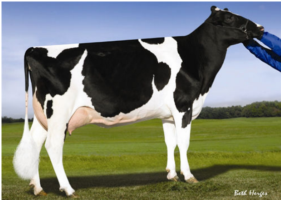
PINE-TREE 2149ROBST 4846 FOURTH DAM